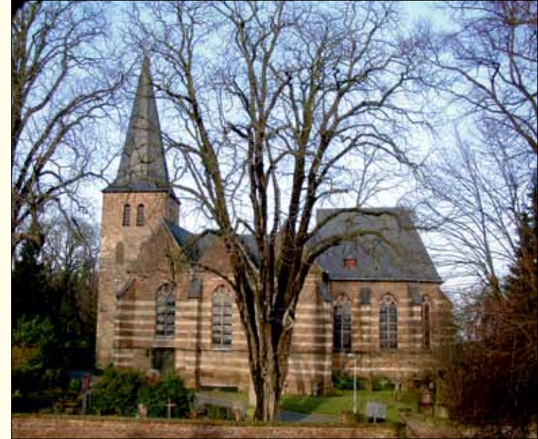
Alt St. Martinus in Stommeln, Foto 2004. Die Kirche hatte im 18. Jahrhundert im Wesentlichen bereits ihr heutiges Erscheinungsbild.